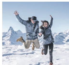
Little City www.littlecity.ch