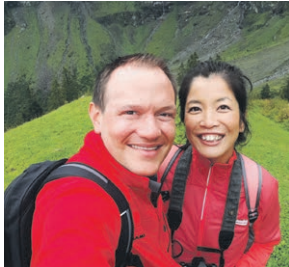
Newly Swissed www.newlyswissed.com

Auf der FINE TO DINE-Online-Plattform erwarten Sie spannende Insidertipps, aktuelle Trends und Neuigkeiten aus der Welt der Lifestyle- und Food-Blogger.